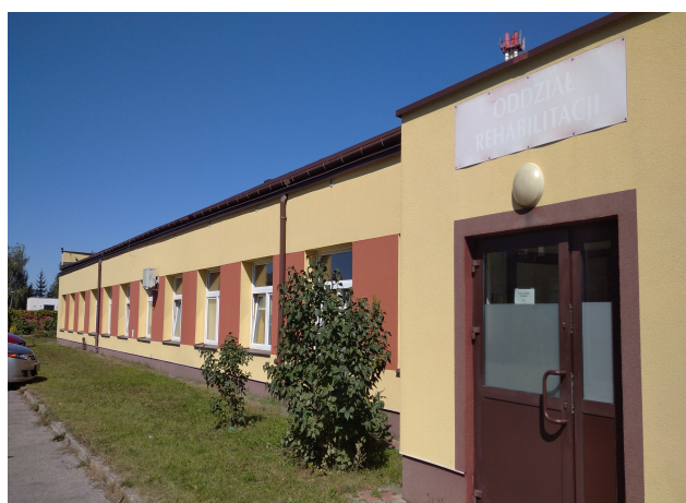
Elewacja południowa 2